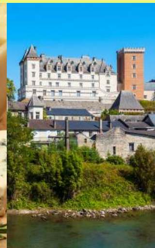
GASTRONOMIE & PATRIMOINE

Parce que nous croyons la notion de plaisir essentielle y compris dans une pratique soutenue, nous avons imaginé pour vous des séjours à thème.