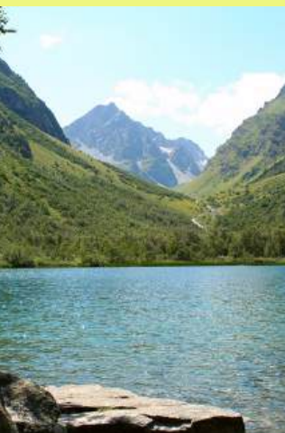
DE LA CÔTE À LA MONTAGNE