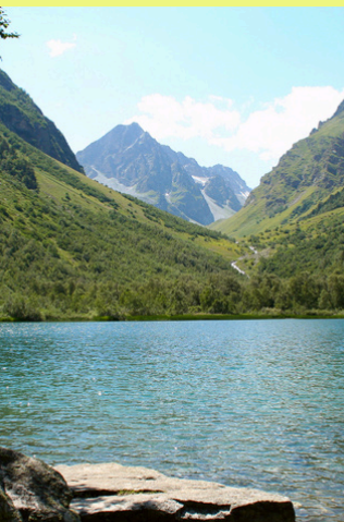
DE LA CÔTE À LA MONTAGNE