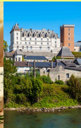
GASTRONOMIE & PATRIMOINE

Parce que nous croyons la notion de plaisir essentielle y compris dans une pratique soutenue, nous avons imaginé pour vous des séjours à thème.